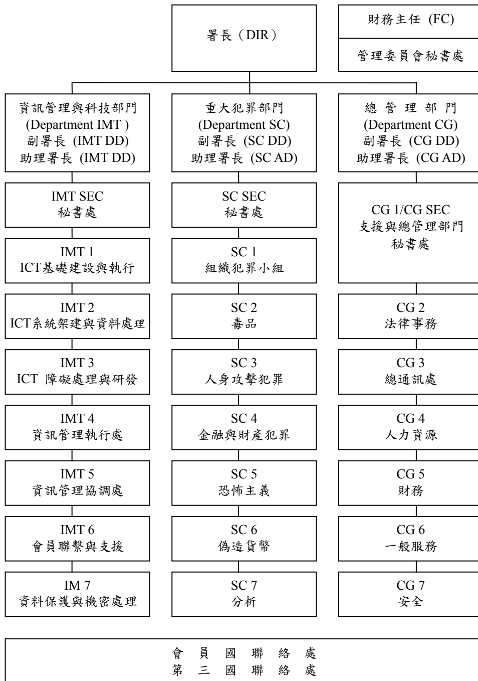
圖二 歐洲警政署組織結構圖